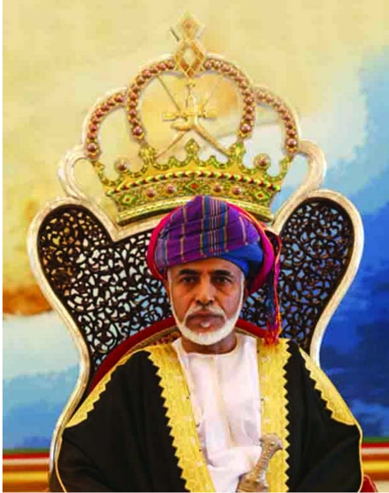
حضرة صاحب الجلالة السلطان قابوس بن سعيد المعظم